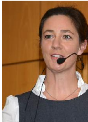
Schulungen: Praxisnah und theoretisch fundiert

Luxemburg wird 2017 der erste Staat sein, in dem der Passivhaus-Standard Mindeststandard sein wird. Um die Ausführung und Qualität der Luxemburger Planungs- und Bauwirtschaft im energetischen Bereich künftig für diese hochgesteckten Ziel sicher stellen zu können, ist ein umfassendes Ausbildungs- und Trainingsprogramm von entscheidender Bedeutung. Durch die Zusammenarbeit mit dem Passivhaus Institut und die langjährige Passivhaus Praxiserfahrung der Referenten entwickelte sich die energieagence zu DER Schulungsinstitution für das ab 2017 geforderte Passiv-(AAA-)Gebäude in Luxemburg.